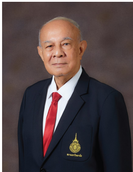
พลเอก จรัล กุลละวณิชย์