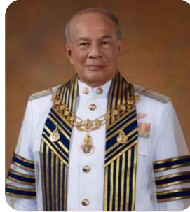
พลเอก จรัล กุลละวณิชย์