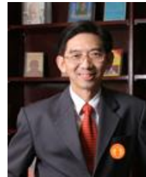
ศ.ดร.สมคิด เลิศไพฑูรย์