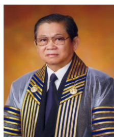
ศ.เกียรติคุณประหยัด พงษ์คำ