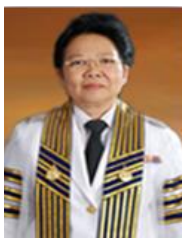
ผศ.อภากร บุญสม รองอธิการบดีฝ่ายบริหาร