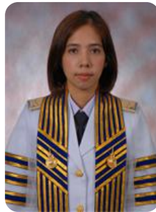
อาจารย์ฟ้าใส สามารถ