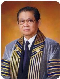
ศ.เกียรติคุณ ประหยัด พงษ์ดำ